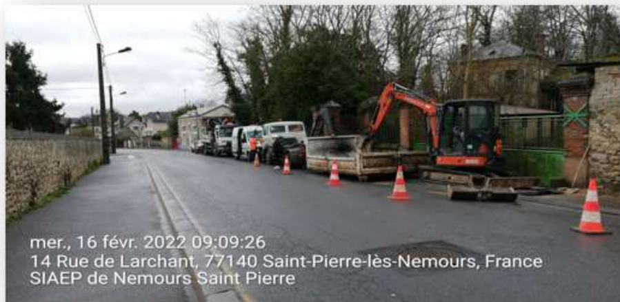
mer., 16 févr. 2022 09:09:26 14 Rue de Larchant, 77140 Saint-Pierre-lès-Nemours, France SIAEP de Nemours Saint Pierre

Renouvellement des 4 branchements plomb Route de Larchant achevé en mai, suivi de la réfection de la RD16